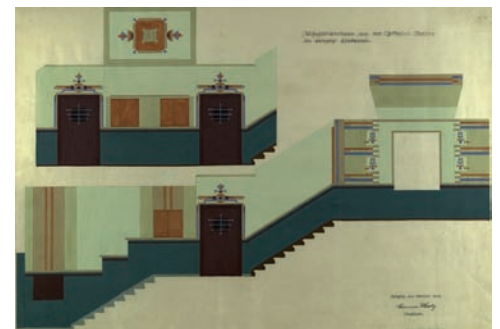
Nicht realisierter Entwurf für die Gestaltung von Treppenhäusern in der Gröpplerstraße, Oktober 1928

Um die Hinterlassenschaft auswerten zu können, ist die Restaurierung der Unterlagen dringend notwendig. Diese kostet allein 90 000 Euro. Das Stadtarchiv und das Zentrum für Bucherhaltung/Stiftung für historische Bücher und Dokumente haben es sich zur Aufgabe gemacht, die erforderlichen Mittel dafür einzuwerben. Sie sind auf jede Spende angewiesen. ■