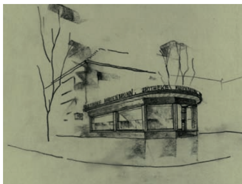
Entwurf für die Apotheke Marienbrunn, 1927

Koppe war außerordentlich flexibel und paßte sich seinen Auftraggebern an. Ende der zwanziger Jahre entwarf er auf Verlangen in modernen Bauformen, wie bei dem Vereinsgebäude des R. C. Sport e. V.