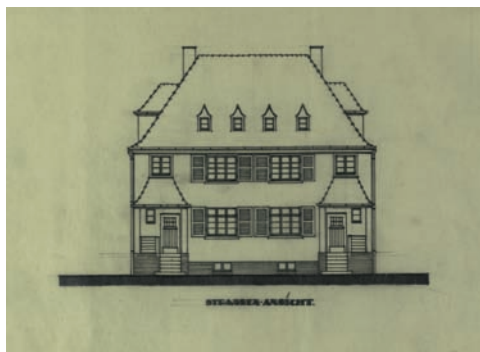
Entwurf für die Siedlung Am Eutritzscher Park, 1926